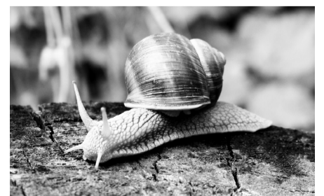
(Материалдар галамтордан алынды).

Түйін: Ұлудың денесі жұмсақ болғандықтан бұл жыл жерге де, елге де құт-берекені, ырыс-несібені мол әкеледі деп есептеген халқымыз. Ұлу жылын ұлы немесе үлгілі деп айдарлауының өзінде де көп мағына жатқаны сөзсіз. Сондықтан, биылғы Ұлу жылы ұлтымызға жайлы, молшылық жылы болсын деп тілейік.